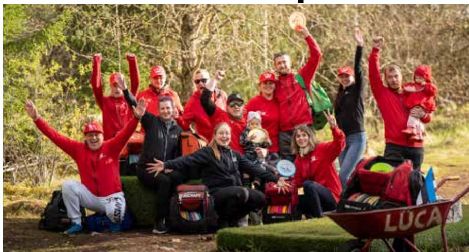
Диск-гольф Wasalemma.

Со временем определились конкретные дни для соревнований. В летний сезон еженедельные игры проходят по втор-