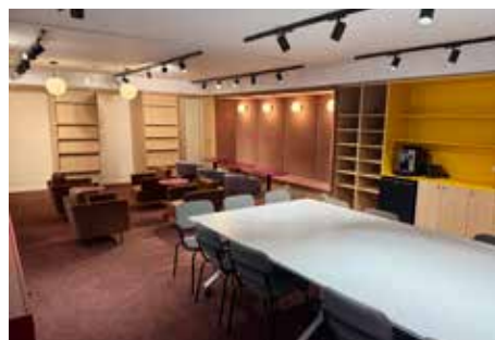
Читальный зал библиотеки после обновления. Работы еще ведутся, и помещение станет еще более уютным для посетителей.