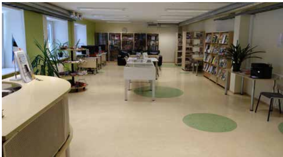
Читальный зал Ляэне-Харьёвской волостной библиотеки до обновления.

На данный момент общий вид читального зала уже обновлён, и в планах – дальнейшее его совершенствование с использованием современных информационных технологий. Для реализации двухэтапного проекта было получено финансирование по программе Министерства культуры «Ускоритель народных библиотек», а также от волостной управы Ляэне-Харью. Вторая часть проекта будет завершена до конца 2026 года.