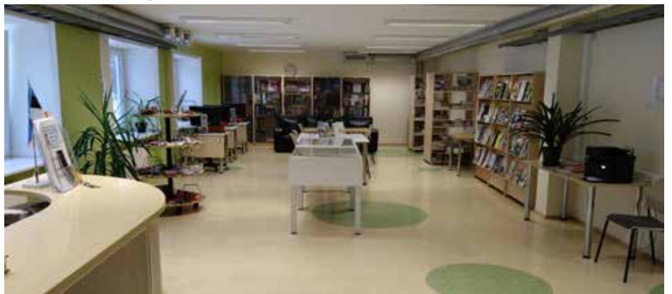
Lääne-Harju valla raamatukogu lugemissaal enne uuenduskuuri.

T änaseks on uuenenud lugemissaali üldine ilme ning plaanis on seda veelgi täiustada infotehnoloogiliste lahenduste näol. Kaheosalise projekti elluviimiseks saadi toetust kultuuriministeeriumi poolt pakutavast „Rahvaraamatukogude kiirendist“ ja Lääne-Harju vallavalitsuselt. Projekti II osa teostatakse hiljemalt 2026. aasta lõpuks.