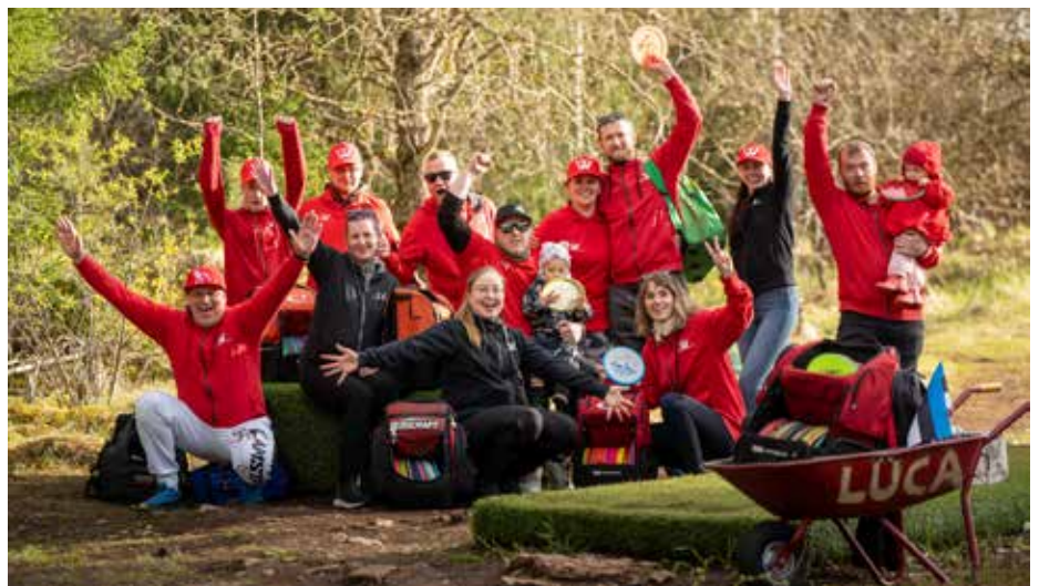
Sportliik seltskond Vasalemma kettagolfi rajal.

kujust märkimisväärselt muutunud. Vaid mõned üksikud rajad on veel ümber kujundamata, kuid ka nende jaoks on ideed juba olemas. Pidev arendamine ongi üks Vasalemma raja tugevusi – eesmärk on hoida rada värske, huvitava ja väljakutsuvana, et nii võistlejad kui ka tavakasutajad leiaksid siit alati põhjuse tagasi tulla.