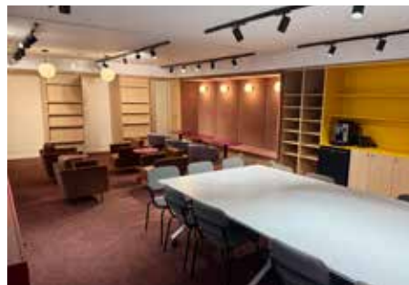
Väike pilguheit raamatukogu lugemissaali peale uuenduskuuri läbimist. Tööd veel käivad ning ruum muutub veelgi küllastajasõbralikumaks.