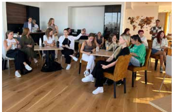
Рабочая группа по составлению профиля здоровья и благополучия, студенты и преподаватели программы укрепления здоровья Таллиннского колледжа здравоохранения встретились в Палдиски

Первый профиль здоровья и благополучия (эст. ТНР) волости Ляэне-Харью был составлен в 2021 году и в дальнейшем будет обновляться каждые 4 года. В этот раз рабочую группу волостного управления, состоящую из 7 человек, активно поддерживают 14 студентов факультета укрепления здоровья Таллиннского колледжа здравоохранения.