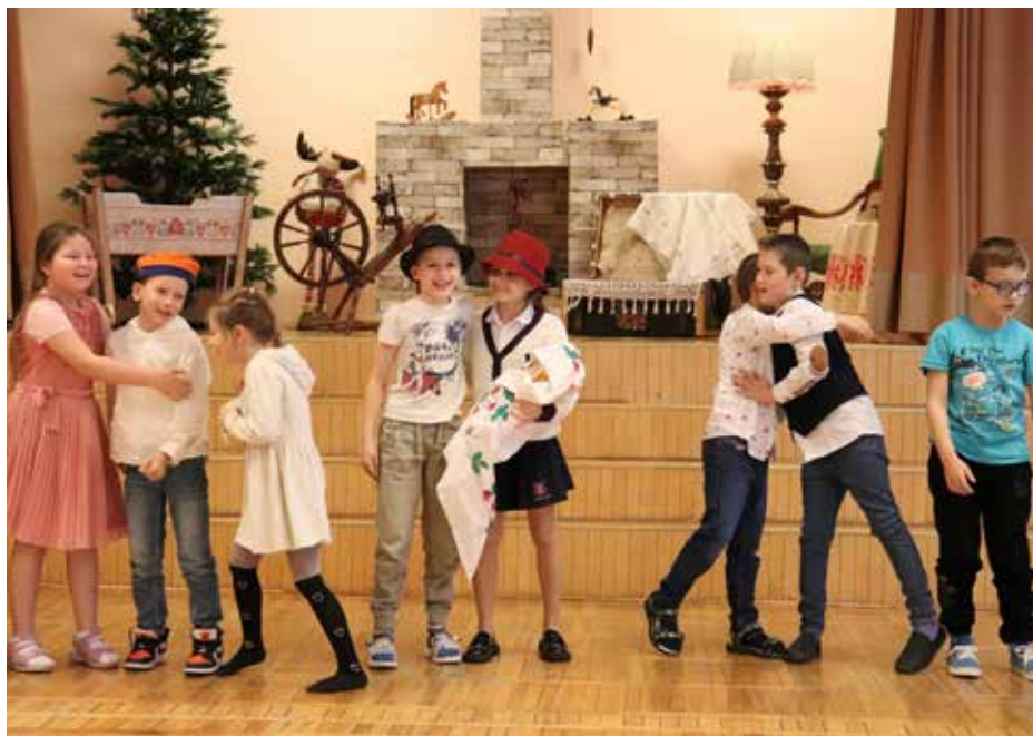
Ряженые в Русской основной школе Палдиски

Первыми на сцену вышли ряженые из 1-го класса и исполнили хороводную песню «Näe, raksus metsas sügaval» под управлением Доминики Сакс. Ряженые 3-го класса отлично станцевали и исполнили известный хит «Mida ütles rebane». Во главе ряженых 2-го класса были Ка-