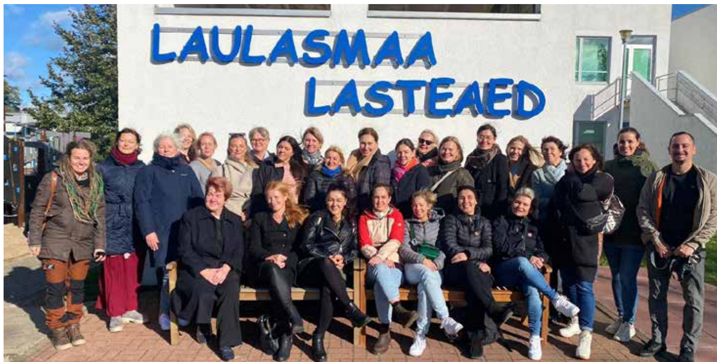
Учителя детских садов из Исландии, Гренландии, Литвы и Швеции посетили детский сад Лауласмаа.

В качестве следующего шага партнеры проекта планируют разработать способы большей поддержки языкового развития детей, чтобы дети умели точнее выражать свои мысли. Тема будет рассмотрена уже