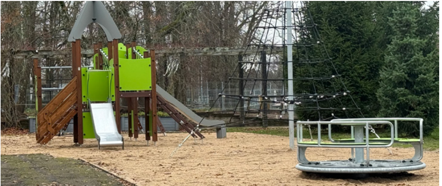
Taolise mänguväljaku ehitamiseks on vaja ligikaudu 15 inimese aastast tulumaksulaekumist.

ДЕКАБРЬ 2025 | No 10 (86) | WWW.LAANEHARJU.EE | LAANEHARJUVALD