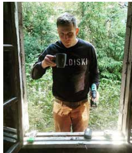
Ehitustööd on alanud suure hooga

Ehitustööd on alanud suure hooga. Tööde maksumuseks on pisut üle 3 miljoni euro. Iga ehitustööga kaasnevad teatavad häiringud, mis sunnivad elanikke oma harjumuspärasest käitumist muutma. Aleviku vahel liigub tavapärasest rohkem ehitamisega seotud masinaid, elanike ohutuse tagamise eesmärgil piiratakse ehitusplatsi aiaga, vahel võib kosta täiendavat müra. Kooli territoorium on alati olnud kõigile avatud ja seda kasutatakse muuhulgas kogukonnamajja liikumiseks. Kogukonnamajas asub raamatukogu, pakiautomaat ja muud. Ehitustööde