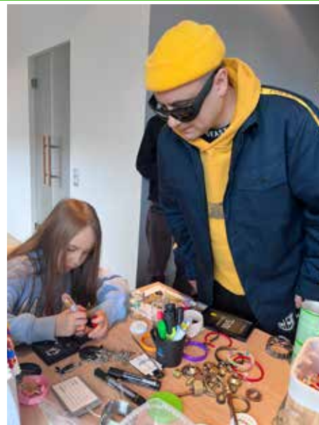
Gameboy Tetris pani ka käed külge ning lasi fantaasial lennata

vanaelektroonikat, mida enam kasutada ei saa. Kampaania olulisim eesmärk on lasteaiakooliõpilaste keskkonnateadlikkuse suurendamine ning taaskasutuse ja jäätmete sorteerimise vajalikkuse teadvustamine. Kampaanias osalemine toimub gruppides, kuna uute harjumuste loomisel on suurim mõju just eakaaslastega koos tegutsemisel. TOIMETUS