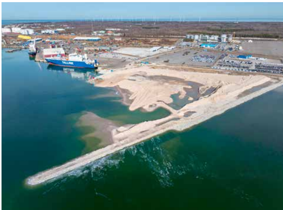
Paldiski Lõunasadama uue kai ehitus

“Kai nr 6A” tähistust kandev kai Paldiski Lõunasadamas tuleb ligi 310 meetri pikkune ning akvatooriumi sügavusega kai ees 13,5 meetrit. See tagab suutlikkuse võtta sadamas vastu suure süvisega eriotstarbelisi laevu, mida kasutatakse näiteks kaitseväetehnika või tuulikute komponentide transportil ning meretuuleparkide ehitamisel. Eesti mõistes on tegemist esimese nii suure kandevõimega kaiga, mis on projekteeritud koormusele 20 tonni ruutmeetrile. Kai ehitusega suureneb sadama territoorium ca 10 hektari võrra.