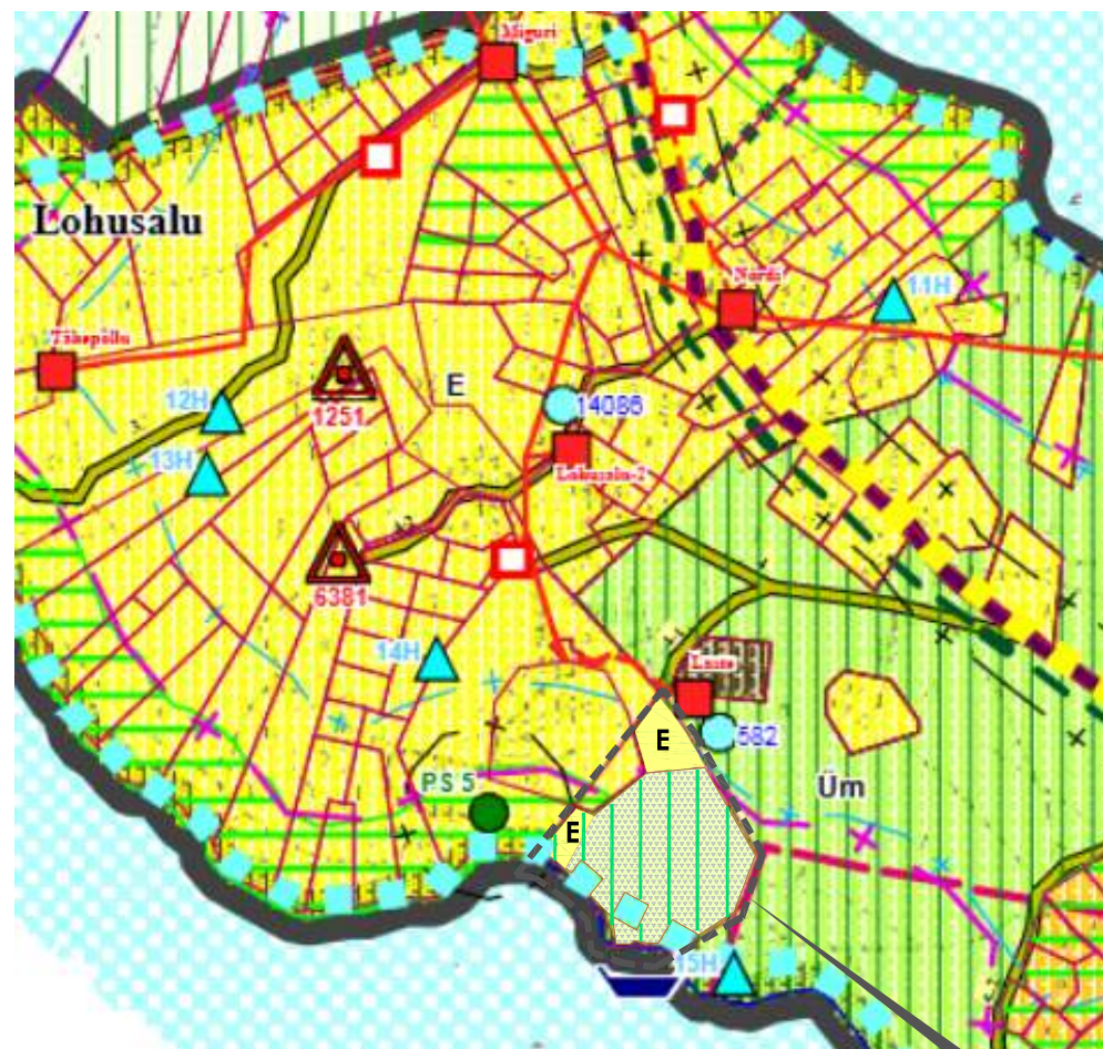
Rannuka tee 13 ja 15 kinnistute ja lähiala detailplaneeringuga tehtav ettepanek: Rannuka tee 13 kinnistu põhjapoolne ja edelapoolne osa muudetakse väikeelamumaaiks, ülejäänud osal kinnistust säilib senine sihtotstarve - maatulundusmaa, looduslik ala (mets)