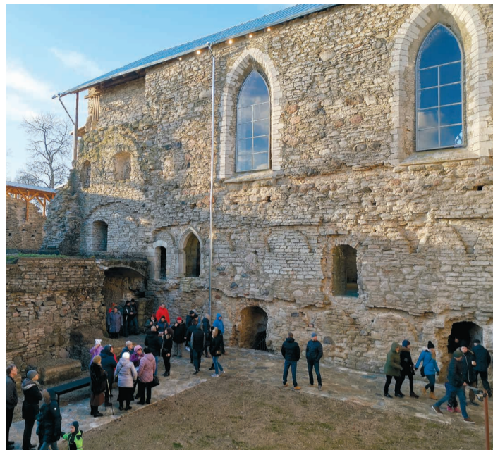
Varasemalt on PKT meetmest toetust saanud projekt „Padise kloostrikompleksi arendamine interaktiivseks külastuskeskuseks“ summas 1 459 850 eurot.

Paldiski Muusikakoolis õpib sellel aastal 66 õpilast nii Paldiski Ühisgümnaasiumi kui ka Vene Põhikooli ruumides. Muusikakoolis pakutakse muusikaalast huviharidust. Vasalemma Kunstide Koolis õpib 97 õpilast ja kool tegutseb Rummu alevikus samas hoones Lääne-Harju Spordikeskusega. Osaliselt viiakse õpet läbi ka Vasalemma Põhikooli ruumides. Lisaks