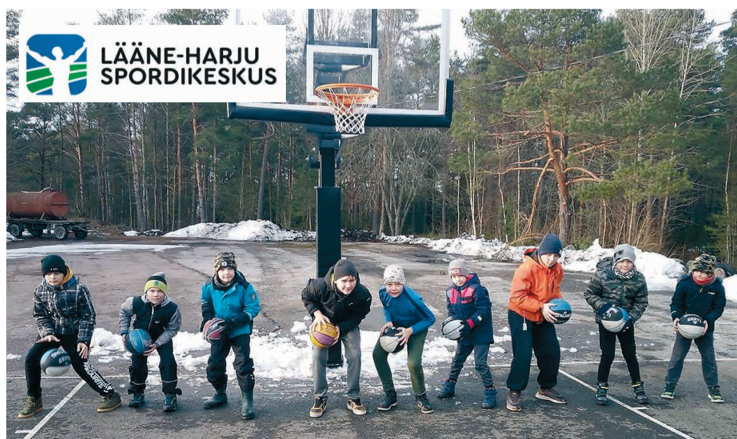
Vasalemma korvpallipoisid treenivad sellel kevadel õues 2+2 reeglit silmas pidades.

▶ Alates märtsist saab Lääne-Harju Spordikeskuse kohta infot asutuse kodulehelt www.laaneharjusport.ee . Veebileht tutvustab sportimisvõimalusi vallas ja kajastab ka spordiüritusi. Samuti jagatakse infot valla spordiklubide ja nende tegemiste kohta. Spordikeskuse kodulehel saab tutvuda 2021. aasta tegevuskavaga ning spordürituste kalendriga. Märtsikuus uuendatakse Rummu spordihoone spordisaali valgustust ning paigaldatakse otsaseina kaitsevõrk, samuti tehakse remont spordihoone kabinetis ja vahetatakse välja osad siseuksed nõuetele vastavaks.