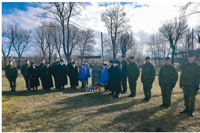
Paldiski Naiskodukaitsje on ellu kutsunud traditsiooni 25. märtsil küüditamise aastapäeval Paldiskis mälestuskivi juures. Koos kodutütarde ja kaitsväelastega süüdatakse küünlad Siberisse teele saadetud eestlaste auks. Fotol mälestusüritus 2019. aastal. Käesoleval aastal avalikku üritust ei toimu.

Naiskodukaitsjana on Hille ka ise koolituse läbi viinud, kus õpetas just välikõõgis tootlust-