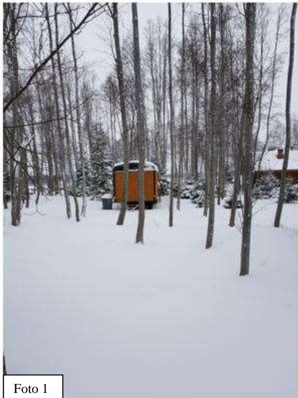
Foto 1. Teenindushoone planeeritud asukoht ja Foto 2. Jalgtee planeeritud asukoht.