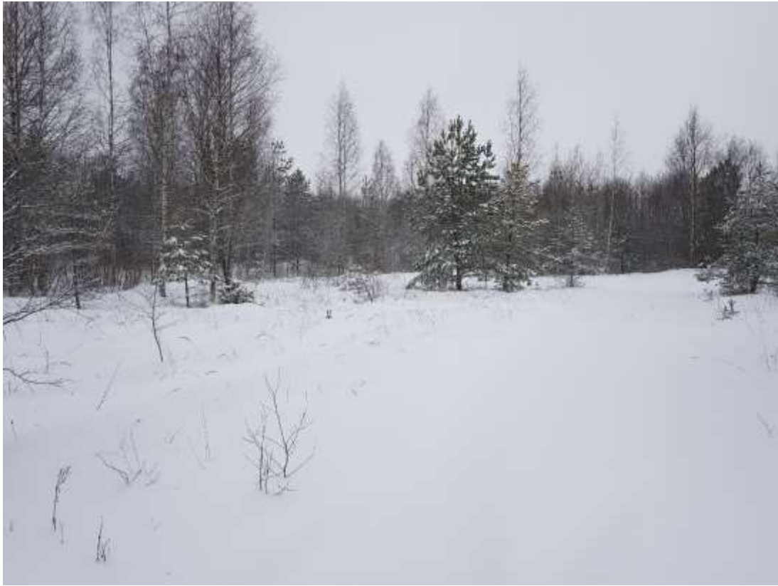
Foto 5. Liivaranna planeeritud asukoht.