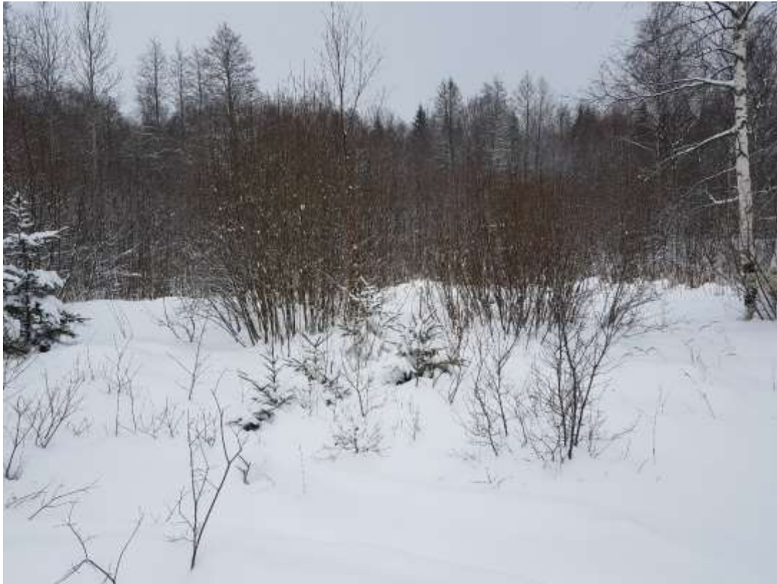
Foto 7. Parkla planeeritud asukoht.