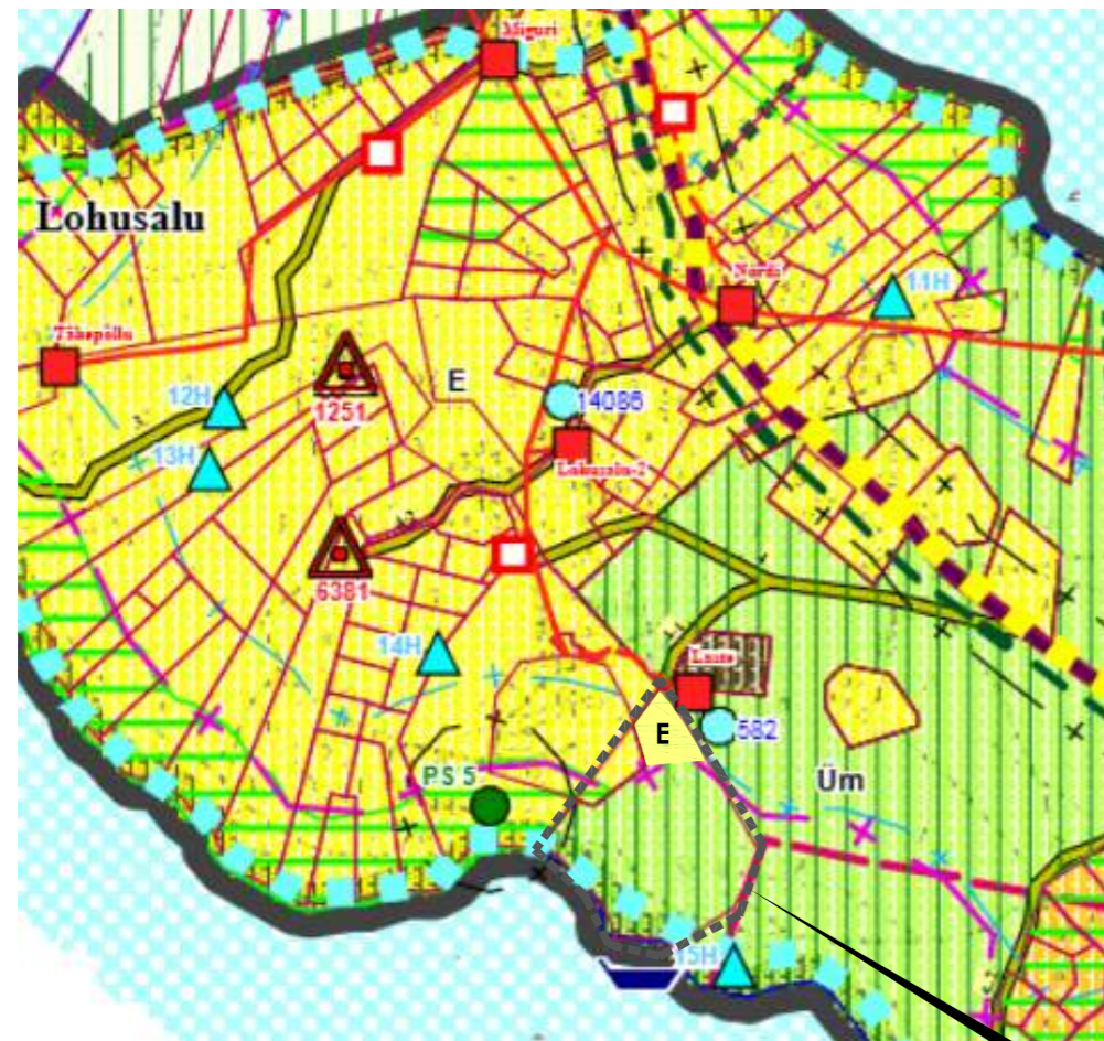
Rannuka tee 13 ja 15 kinnistute ja lähiala detailplaneeringuga tehtav ettepanek: Rannuka tee 13 kinnistu põhjapoolne osa muudetakse väikeelamumaaks, ülejäänud osal kinnistust säilib senine sihtotstarve - Maatulundusmaa