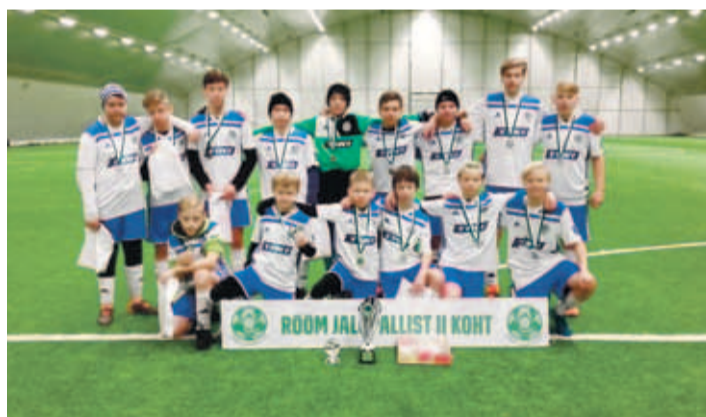
Клуб Вазалемма, мальчики 2005 г.р.