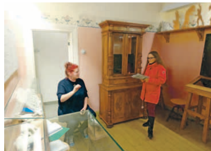
Репетиция спектакля в музее А. Адамсона.

Спектакль, билеты на который можно приобрести в свободной продаже, будут играть в декабре два воскресенья подряд: 9 и 16 декабря в 12.00. Спектакль состоится также 13 января в 12.00. Количество мест ограничено, информация по телефону 6742013. Для детских садов и школ спектакль играют в соответствии с заказами – о своем желании нужно сообщить по эл. адресу amandusadamson@hmk.ee или позвонить по номеру 674 2013. | Мерле Танк , музей-ателье Амандуса Адамсона