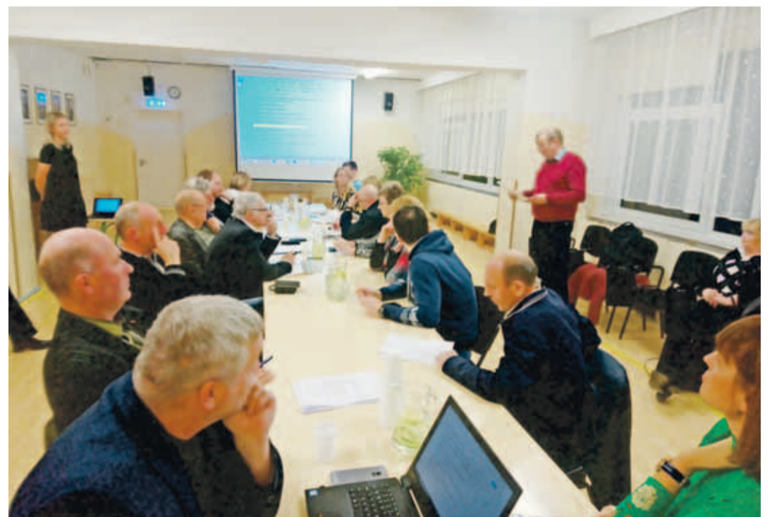
Октябрьское заседание волостного собрания прошло в уютной школе Лехола.