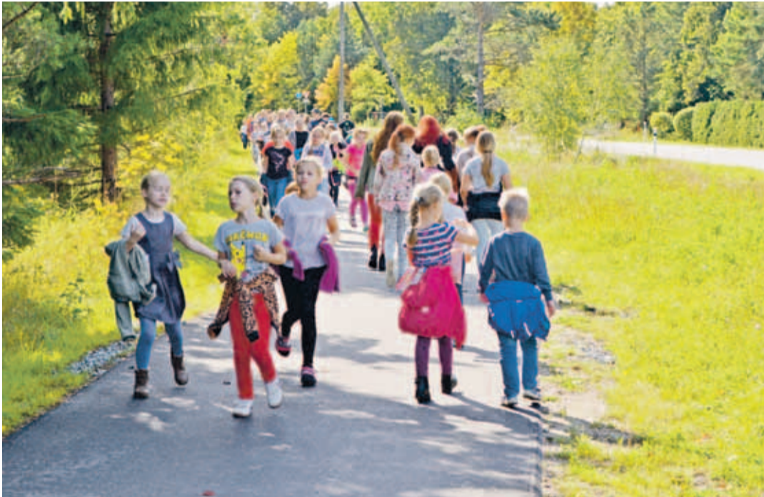
В течение следующих 4 лет, согласно бюджетной стратегии, планируется инвестировать почти миллион евро на строительство вело-пешеходных дорожек.

“Конечно, план, получивший одобрение волостного собрания в октябре, не является окончательным и закрытым на весь период его действия – это, скорее, первый указатель направления на пе-