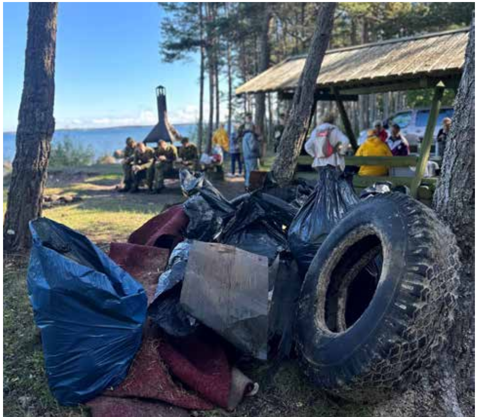
Talgud RMK Leetse telkimisalal 2023.

Kahjuks näeme sageli tossamas lõkkeit, kus põletatakse ebasobivaid esemeid nagu vana mööbel, riided, jalanõud, rehvid, ehitusjätmed ja muu kasutuks muutunud kraam. Selliseid asju kindlasti lõkkesse panna ei tohi. Jäätmete põletamine on keelatud, kuna see kahjustab keskkonda ning inimeste tervist. Jäätmete põletamisel tekkinud mürgised ained saastavad mitte ainult õhku, vaid ka maapinda, jõudes sealte aiasaadustesse ja kandudes edasi põhjavette.