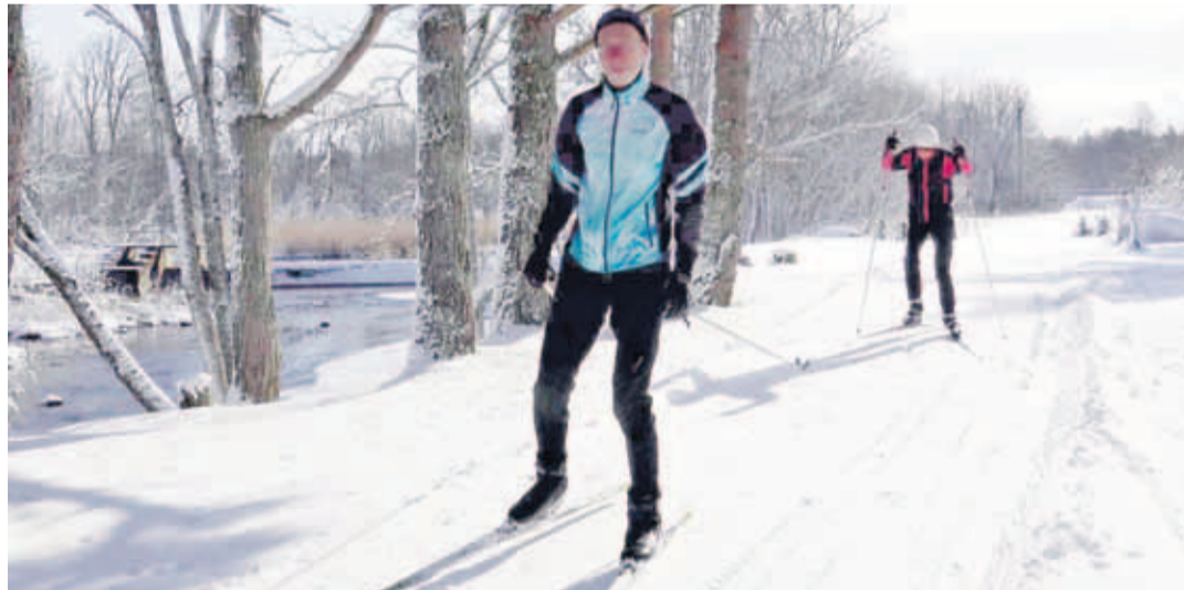
На лыжной трассе Ванавески уже первый снег. Гуйдо призывает всех двигаться на природе для улучшения здоровья.

Для начала в окрестностях Ванавески был создан участок длиной 1,5 км, который на сегодняшний день снабжен освещением. Это положило начало развитию задумок. К зиме 2018 года была построена петляющая вокруг деревень Ланга и Мадизе 10-километровая лыжная трасса, которая проходит по пересеченной местности, – здесь чередуются сосновые и березовые леса, альварные сенокосы и болота. Возможно, уже в будущем году трассу удастся продлить до деревни Керсалу. Самые смелые планы – объединить силы и соединить лыж-