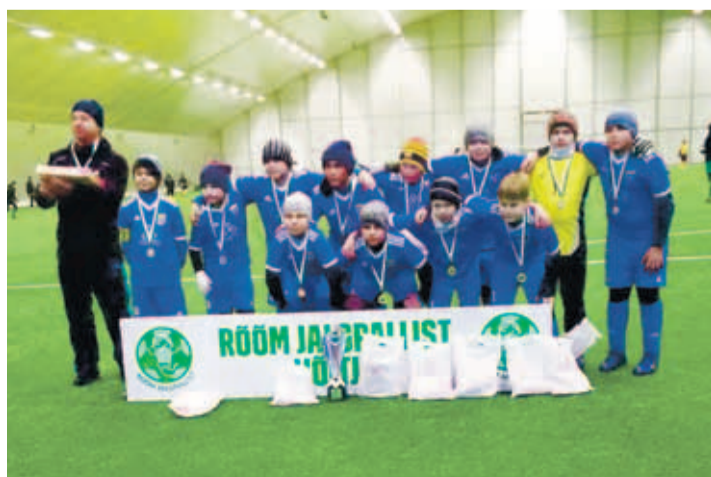
В Чемпионате Эстонии 2018 участвовали две детские команды: Rakri SK Alexela 2010 и Rakri SK Alexela 2008, которая входит в 15 лучших команд Эстонии. В начале декабря ребята участвовали в турнире "Rõõm Jalgpallist 2018" и выиграли его!