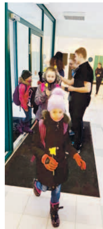
▲ Мальчики школы Падизе порадовали девочек утренними цветами.