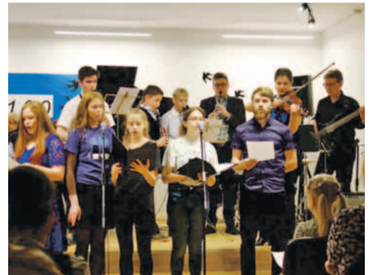
В этот юбилейный год мы предложили такой концерт на суд особенной и требовательной публике – ученикам основной школы.